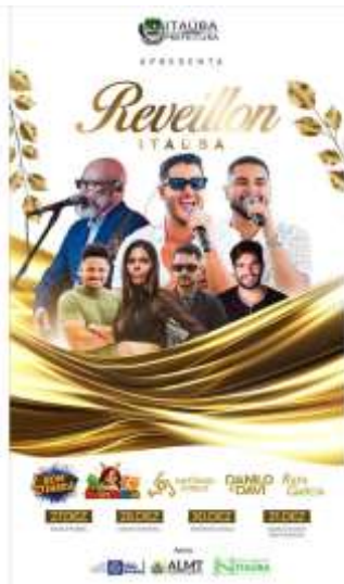
São José – Country Bulls